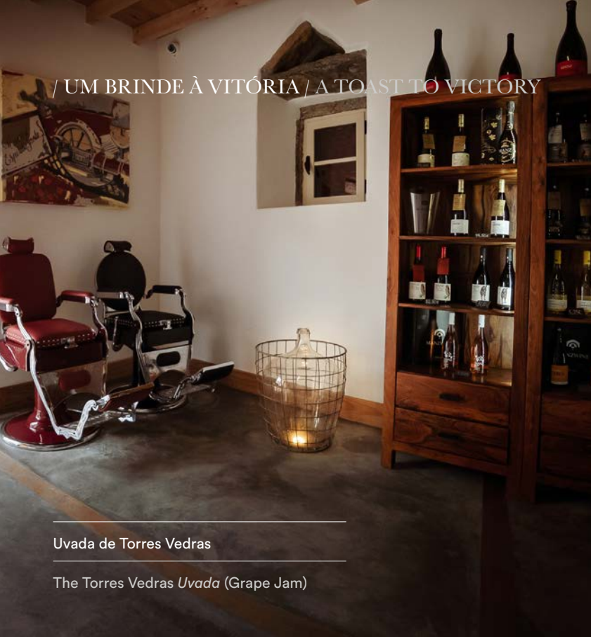
Uvada de Torres Vedras