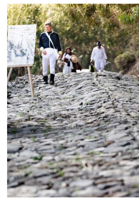
Estrada militar do Alqueidão