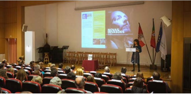
Dia Nacional das Linhas de Torres 2019.