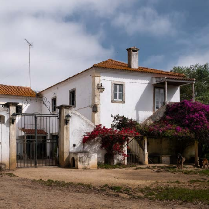
Quinta da Póvoa.

The logo symbolizes the bulky nose of the first Duke of Wellington in the form of a shaded half-pear, evoking not only the intense aroma of ripe fruit present in a premium distillate, but also a more romanticised ‘B-side’ of the experience in the Lines of Torres Vedras, ironically reported by