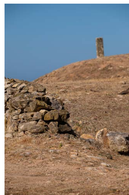
Forto do Zambujal

In order to facilitate cooperation between European countries particularly interested in the development of cultural itineraries, the Committee of Ministers of the Council of Europe instituted, in 2010, the Extended Partial Agreement on Cultural Itineraries. Another resolution came