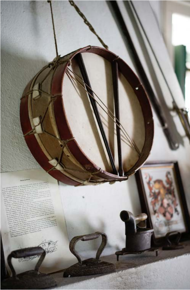
Caixa de guerra britânica (pequeno tambor)