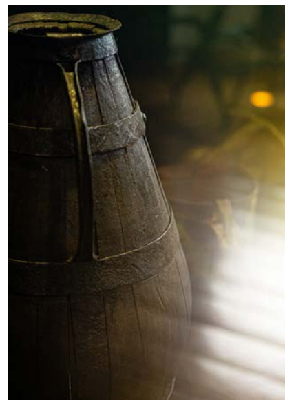
Sala de barricas da ManzWine.

Good reasons to come to Cheleiros to meet ManzWine and taste the wines, certain that you will take with you a great experience to tell your friends.