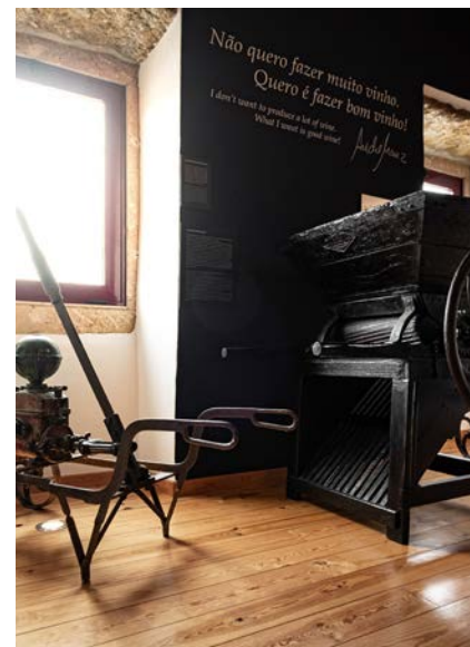
Loja / Museu.