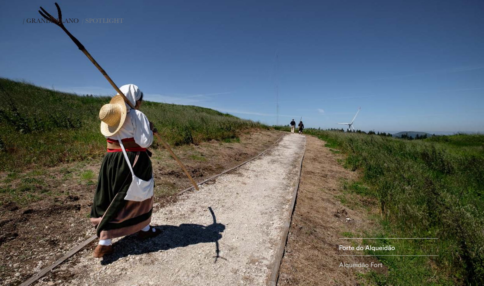
Forte do Alqueidão