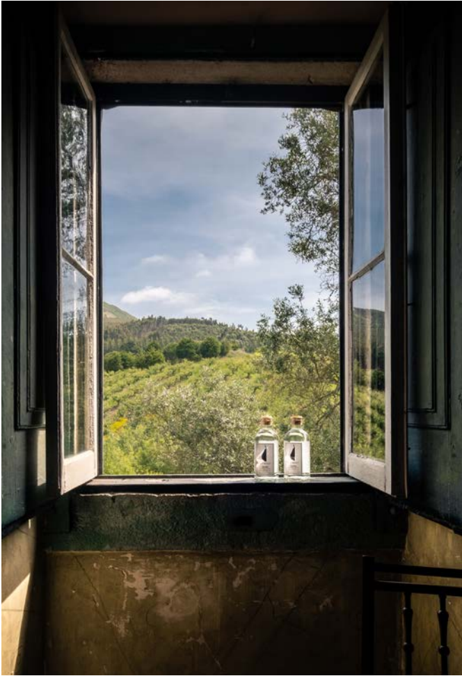
O Old Nosey foi lançado oficialmente a 24 de Novembro de 2018