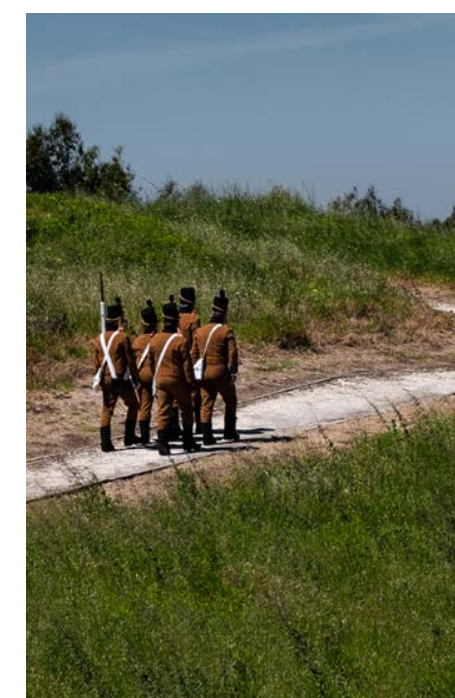
Forto do Alqueidão